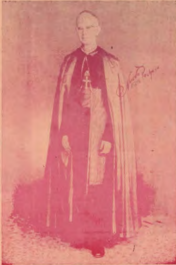
EXCMO. MONSEÑOR DON RUBÉN ODIO HERRERA nuevo Arzobispo de Costa Rica

Usa espejuelos habitualmente. No goza de buena salud. Padece, de