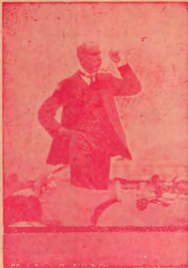
Lic. don Ricardo Jiménez O.

—Cuando se acercaron a mi oficina con objeto de invitarme para asistir a la inauguración de la Fuente de García Flamenco, sentí la impresión que siente el deudor cuando la presentan un pagaré que no puede cancelar. Como Presidente de la República puedo y debo asistir a inauguraciones de puentes, de escuelas y demás festividades de carácter público en donde puedan reunirse libremente los ciudadanos; pero no debo ir a sitios en donde haya tendencias de grupos contra grupos o en donde pueda verse un solo átomo del espectro del odio entre costarricenses. Si esa fuente al maestro García Flamenco corresponde al deseo nacional, no necesita de mi presencia para ser inaugurada, y si ha de necesitarla podría creerse que no corresponde bien a ese deseo. El Presidente debe ser como el agua que ha de brotar de esa fuente, limpia y para todos, sin preguntar al caminante a qué partido pertenece,