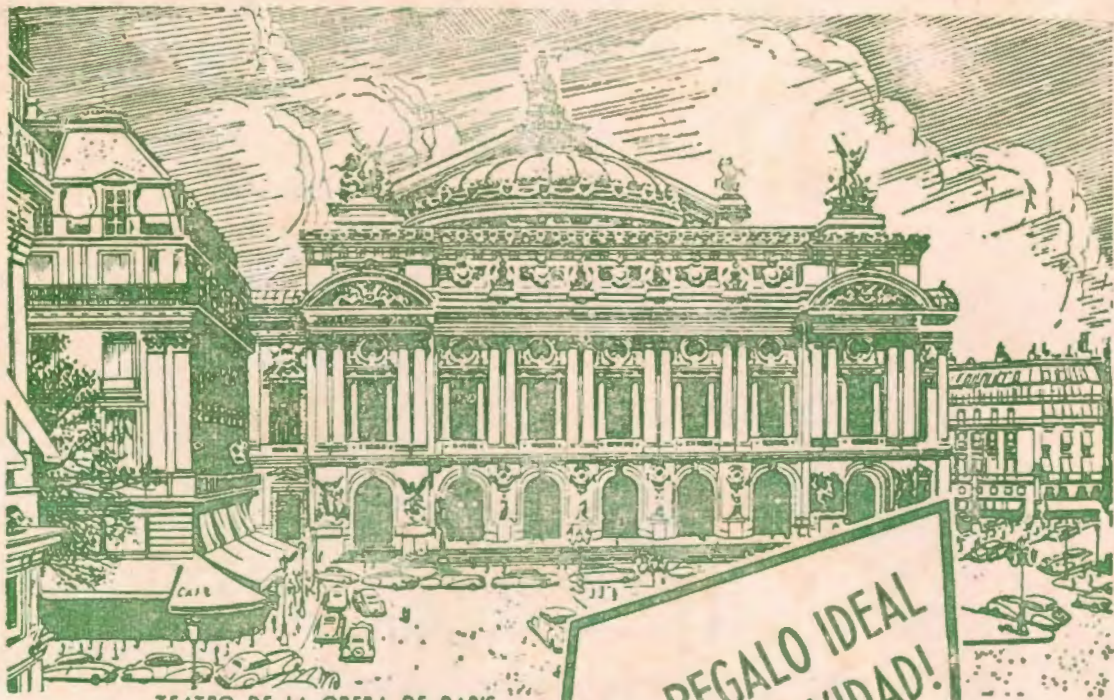
TEATRO DE LA OPERA DE PARIS