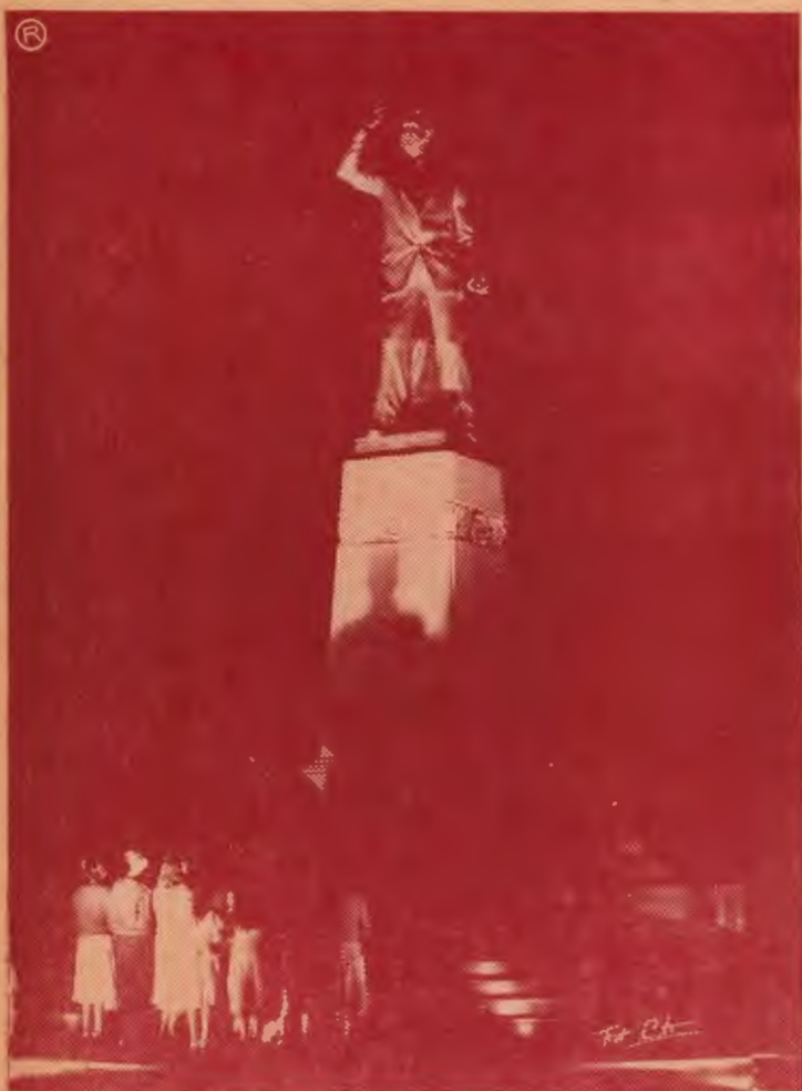
MONUMENTO AL BENEMERITO LIC. DON LEON CORTES CASTRO

"Yo estoy y estaré siempre al lado del pueblo, de los ciudadanos como vosotros, que representáis todo lo sano y fuerte de la ciudadanía costarricense".